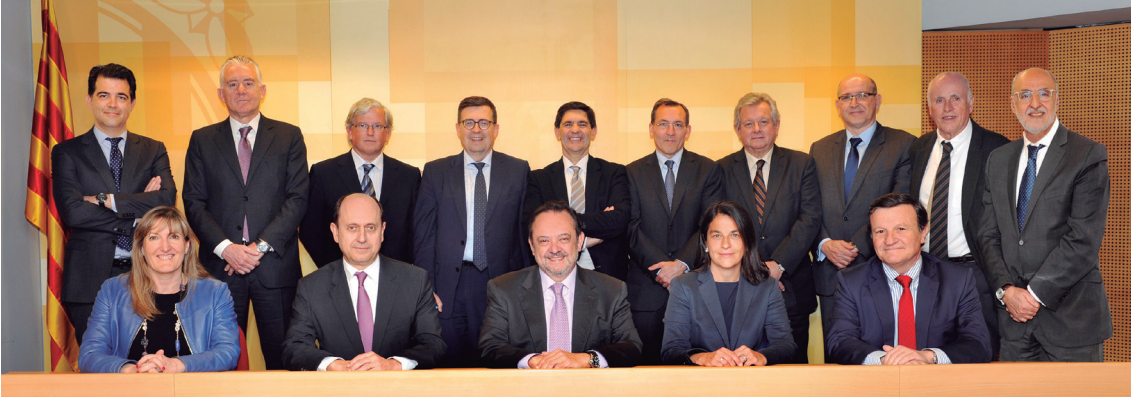
Consell d'Administració Consejo de Administración